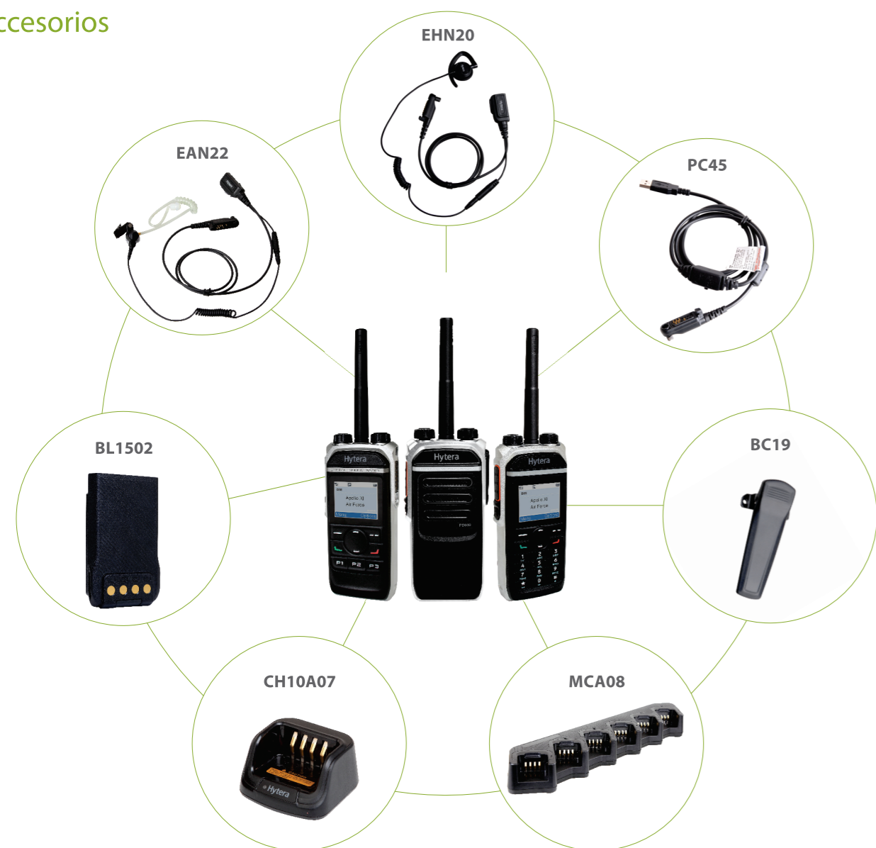
Las imágenes anteriores son de referencia y pueden diferir de los productos reales.